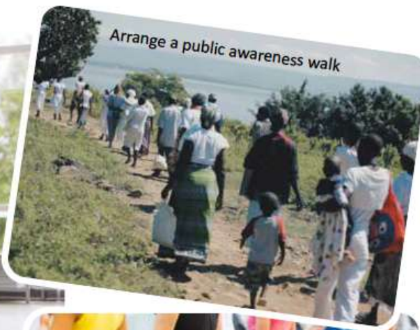
Arrange a public awareness walk