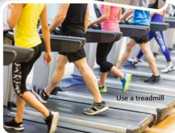
Use a treadmill