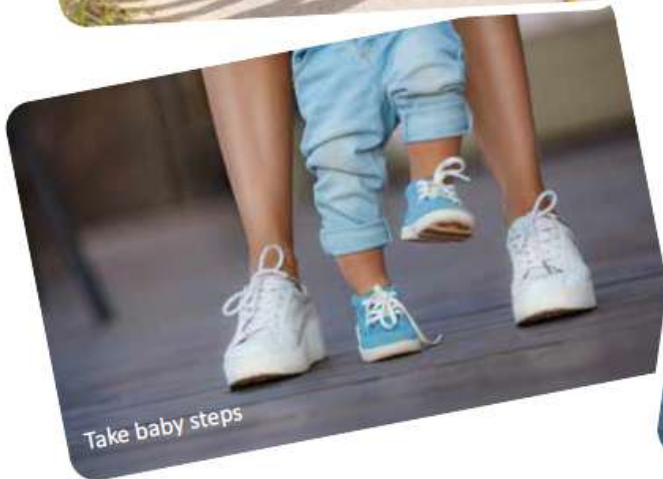
Take baby steps