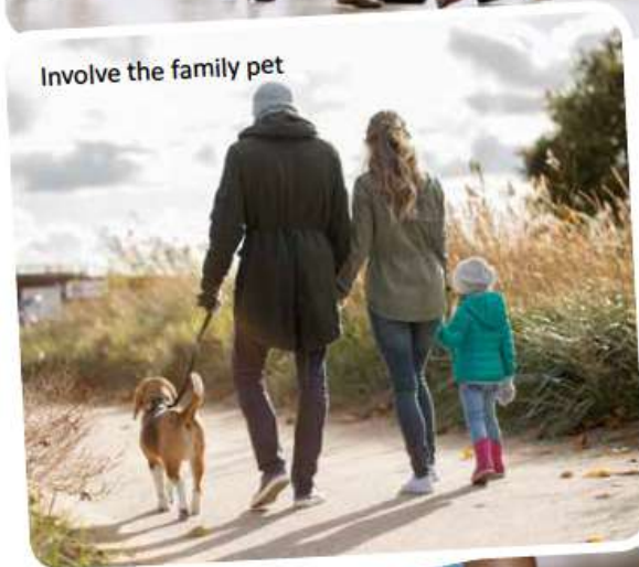
Involve the family pet