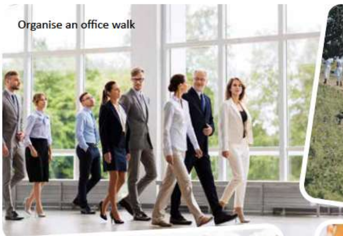
Organise an office walk